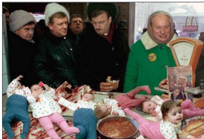
Худ. Андрей Будаев. «Монетизаторы» (Гайдар, Греф, Чубайс, Зурабов)

После того, как прошёл первый шок от социальных потрясений, демографическое положение в России стало понемногу улучшаться. По сравнению с 1995 годом рождаемость возросла на треть, сократилось число аборт, убийств и самоубийств. Однако по-прежнему высокой — на уровне развивающихся стран — остаётся смертность: 14,2 человека на тысячу (в 1980 — 11,0), хотя пик вымирания пройден. Высокую смертность новорож-