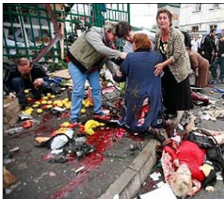
Теракт в Льеже