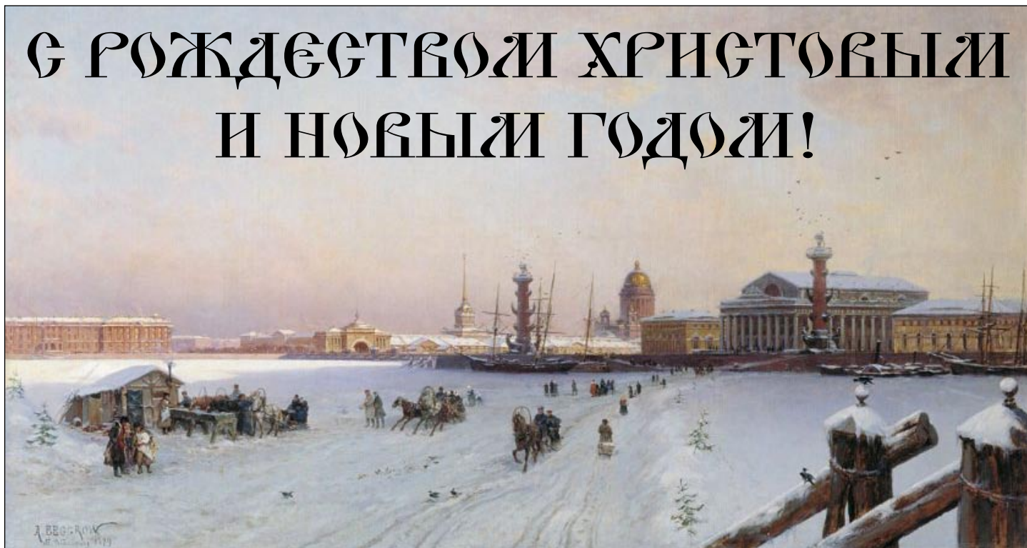
А. К. Бегров. Вид Невы и стрелки Васильевского острова с Фондовой биржей. 1879