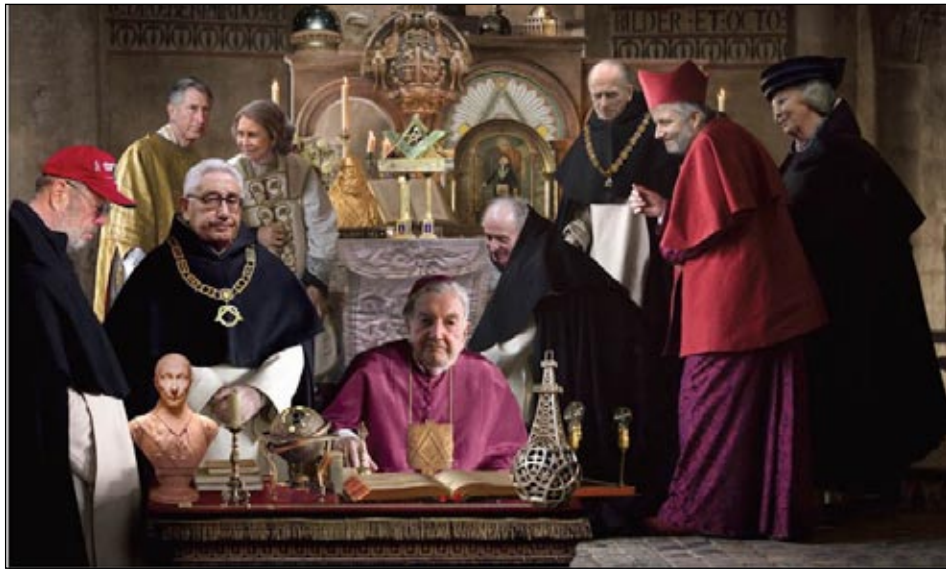
Худ. Андрей Будаев. Всевидящее око