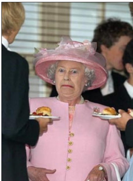
«Стрихнин или полоний?»

В случае смерти одного из лиц «номер один» трансляция на всех телеканалах и радиостанциях компании BBC будет приостановлена,